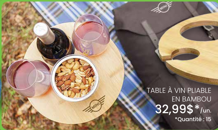
TABLE À VIN PLIABLE EN BAMBOU